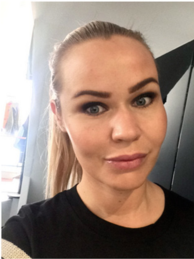
Efter ( 1 ml )